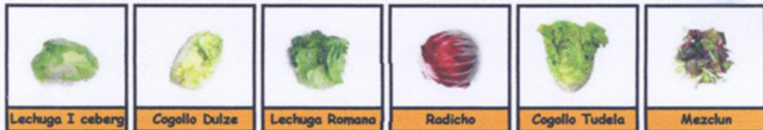
Lechuga I ceberg